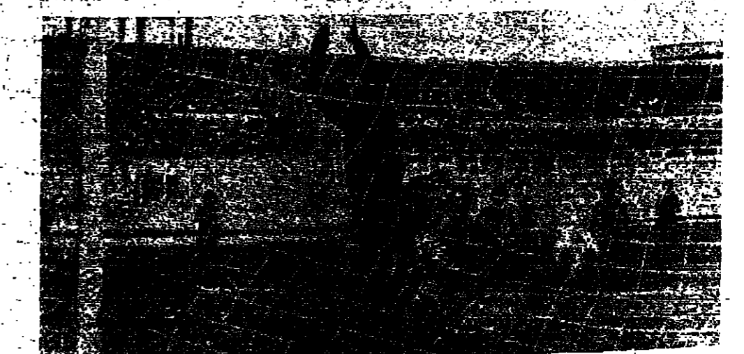
س الهولنديين يقفز الى فوق الكرة تهيئ لاحت بعد ما صدها المارضا واصاعت على النجمة ترضية التسجيل

كتب ابراهيم عبياتي : استطاع فريق الهولنديين ان يمسك امان النجمة ويضرب اياه نتيجة صفر - ١ في المباراة التي جرت بعد الظهر على ملعب المدينة الرياضية . لم يمض وقت طويل حتى ابدى الهولنديون اي مواجبة الهجوم واستفادوا مرة اخرى من هذه الفرصة من الضيق مرتين وهذا ما حرم النجمة من الضيق على الهولنديين بعد كثير من غسود دفاعي الا ان النجمة كان من نتيجة هذا ان حارسي المرمى لم يرتبوا على الارض الا نادرا . الخطوط الاولى وهذه المباراة يبدأ هذا الشوط بنشاط من الهولنديين ثم يصل الى حيد الخطورة من مرمى النجمة ثم ما لبثت الكرة ان انتقلت لخدمة النجمة وفي الدقيقة ٩ وكرة راس خلفية من الفول للخطيب عالجها الآخر بسديدة والتمه من خارج المرمى الكبر استقرت في الزاوية العليا اليسرى لرمى خوزي . في الدقيقة ٢٥ يقذف آخر مرميه في المرمى الخالي لتعود المواجهة بعد اربع دقائق وتتقدم من تلقية وحدهم الخطيب ، حسن شاتلا . لما لعب للهولنديين : خوزي ، باتوس ، سلافان ، آيو ، غاسكين ، سورين ، سلكو ، الصفر ، ميهيه ، زاني ، هوسيك ، كويك ، بيدروس ، وراي . قند المباراة المحمسة تلاح وعاونها احمد جيق ومحمد تمني .